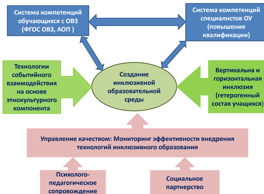
Рис. 1. Модель инклюзивного образования «В мире без границ» в ГБОУ СОШ №232 Адмиралтейского района Санкт-Петербурга